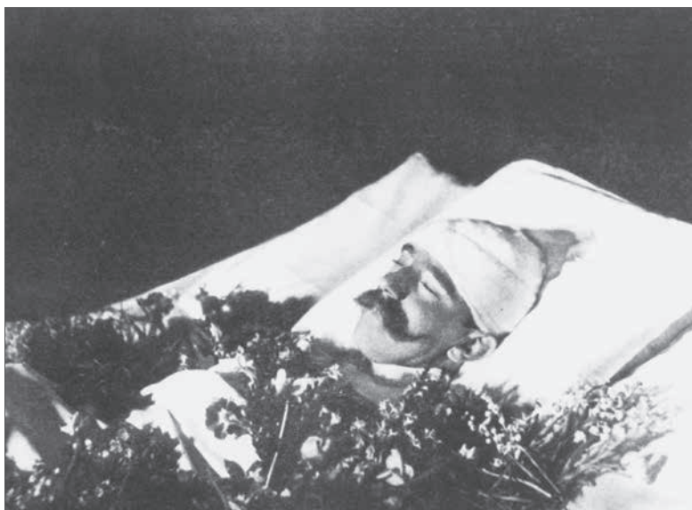
Rudolf trónörökös a ravatalon 1889

– Ugye megmondtam bátyámnak, hogy ez nem jó jel, hogy megtért.