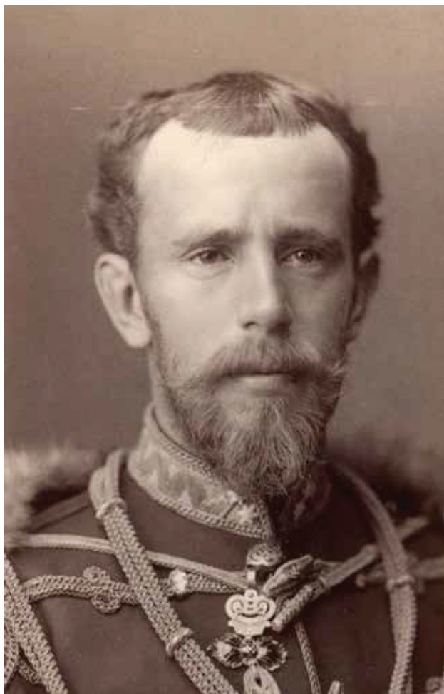
Rudolf trónörökös az Osztrák- Magyar Monarchia tábornoki egyenruhájában 1886

Rudolf halálának könyvtárnyi irodalma van, s érthető módon nagy visszhangot keltett szinte azonnal a tragédia nyilvánosságra hozatalát követően. Újságcikkek, visszaemlékezések, ponyvanyomtatványok egész sora íródott róla, s a „megbízható hírek” iránti felfokozott vára- rakozást