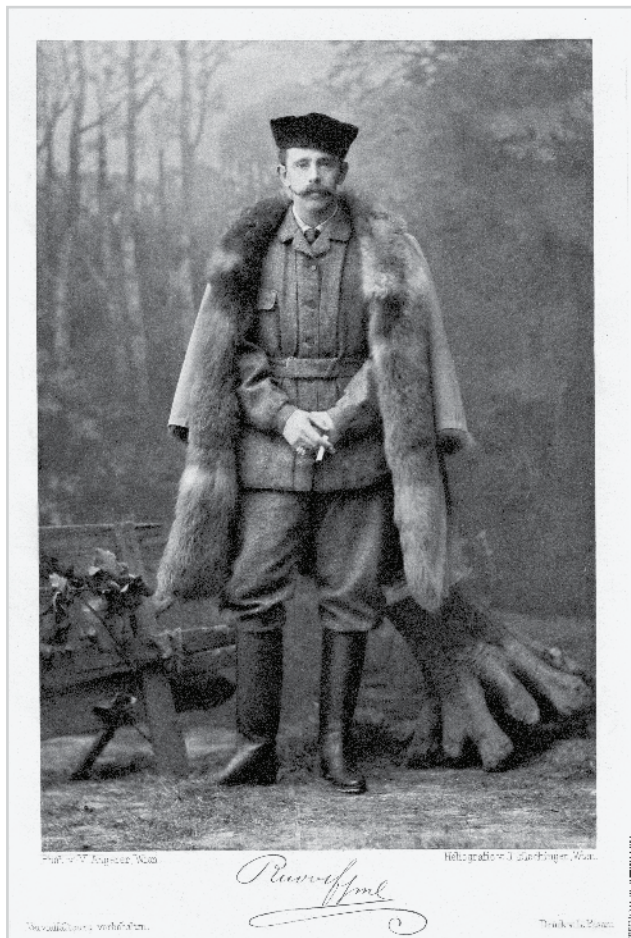
Rudolf trónörökös vadászaton 1888

egészült egész sor nemzetközi vándormotívummal, és számos korábbi magyar történeti személyiség folklórából is magához vonzott, adaptált, aktualizált bizonyos elemeket. Főként Mátyás király népi hagyományköréből került át több folklórelem (álruhában járja az országot, pártolja és segíti a szegényeket, csak távozása után döbbenek rá valódi kilétére stb.). A Rudolf-mondakör népszerűsége a századforduló éveiben tetőzött, majd az első világháború idején érte el újabb csúcspontját, amikor a frontról hazatért katonák terjesztettek róla újabb és újabb, hitelesnek mondott híreket. Ezek azok az évtizedek, amikor ponyvafüzetek tucatjai jelentek meg róla, és amikor a magukat Rudolfnak valló szélhámosokról írt