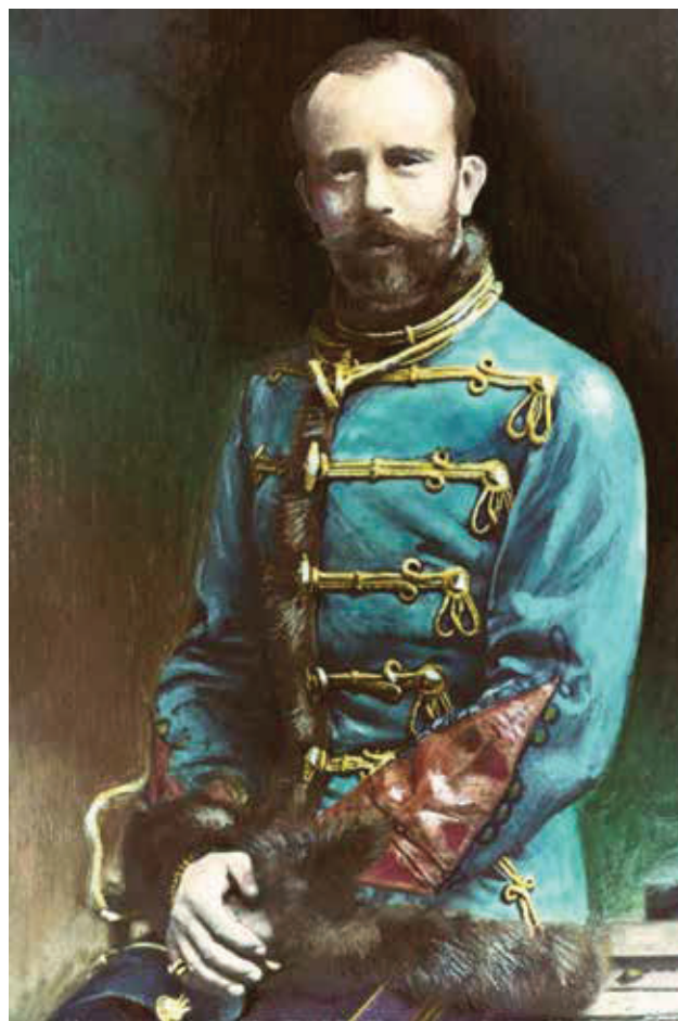
Rudolf koro- naherceg az Osztrák–Magyar Monarchia tábornoki egyenruhájában 1888

A magyar történeti folklórhagyományok hősmondáinak tragikus színezetű vonulatába illeszkednek azok a népi elbeszélések, melyek arról szólnak, hogy Szent Imre, majd Zrínyi Miklós után Rudolf is vadászbaleset, illetve vadászbalesetnek beállított politikai gyilkosság áldozata lesz. Az alábbi, Dél-Erdélyben feljegyzett monda a Szent Imre-mondakör egy Moldvában gyűjtött, klasszikus szépségű népi elbeszélésére emlékeztet. 17 Mindkét