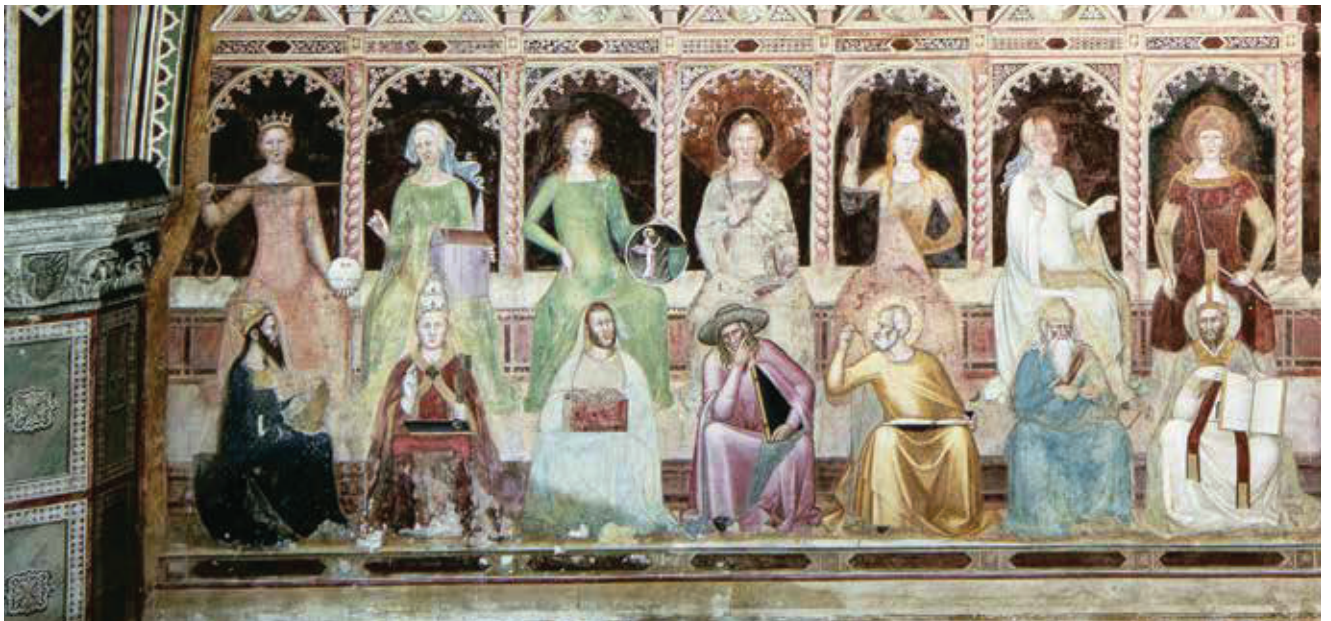
Andrea di Bonaiuto: A hét szent tudomány (magánjog, kánonjog, filozófia, Szentírás- tudomány, teológia, szemlélődés, prédikáció) Santa Maria Novella, freskó részlet XIV. sz., Firenze

Egyáltalán nem mindegy tehát, hogy mi van az ember „fejében”. A filozófia annak iskolázása, ami a szem mögött van, vagyis az ember legkonkrétabb, hozzá legközelebb álló valóságszférájába nyúl bele. Az, hogy a világot hogyan látom, hogyan értem meg, túlbecsülhetetlen jelentőségű, még akkor is, ha ez a látás nem manifestálódik konkrét „cselekvésben”. A filozófia a „belső” „gyakorlatoztatása”, de korántsem abban a l'art pour l'art értelemben, ahogy azt egy keresztretjtvény teszi, hanem a legkomolyabb egzisztenciális következményekkel. A filozófia minden gondolatot az élére állít. Már messze az egzisztencializmus előtt is minden filozófia egzisztenciális volt, mert mindig is átalakította az embert. Míg ugyanis a gyakorlatinak nevezett tevékenységek során az ember a világot változtatja meg, addig a filozófia során önmagát alakítja át. Hogyan is lehetne a filozófia – a bölcsesség! – pusztá elmélet? A filozófia az ember világban való tájékozódásának és mozgásának – magának az életnek – a „segéd tudománya”. Ha valaki ráébred arra, hogy a filozófia és általában a filozófiai gondolkodás révén bepillanthat a világ, a társadalom és a kultúra fenomenális