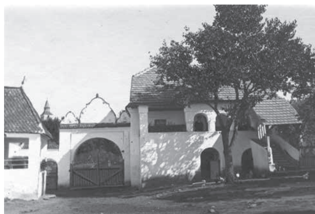
A Simon-kúria udvara 1930-as évek

„A fejlődés középpontja, irányítója Háromszék lehetett, innen valók a legfontosabb emlékek és itt alakult ki a nemesi kúriának egy új típusa. A háromszéki kúriát az jellemzi, hogy a homlokzat közepén az épülettetből árkádostornác ugrik elő. [...] A háromszéki derűs, barátságos kúriatípus a Barcaság szász épületeire is erősen hatott.” 12