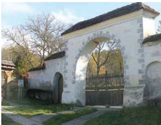
A Zsigmond-kúria nagykapuja a restaurált díszítőfestéssel 2010

módon újraraktuk és lecserepeztük, az idősebb emberek meghatódva álltak meg mellette. Az elmúlt években négy hasonló körítőfal épült vissza Bikfalván, és reméljük, hogy a sor még folytatódni fog.