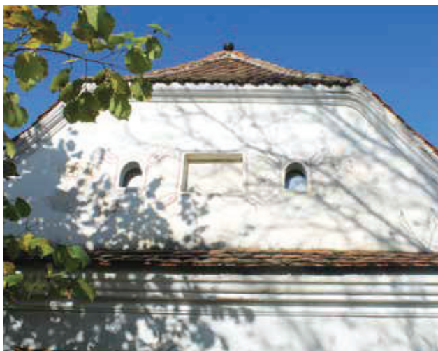
A Koréh–Dénes-kúria oromzata 2020