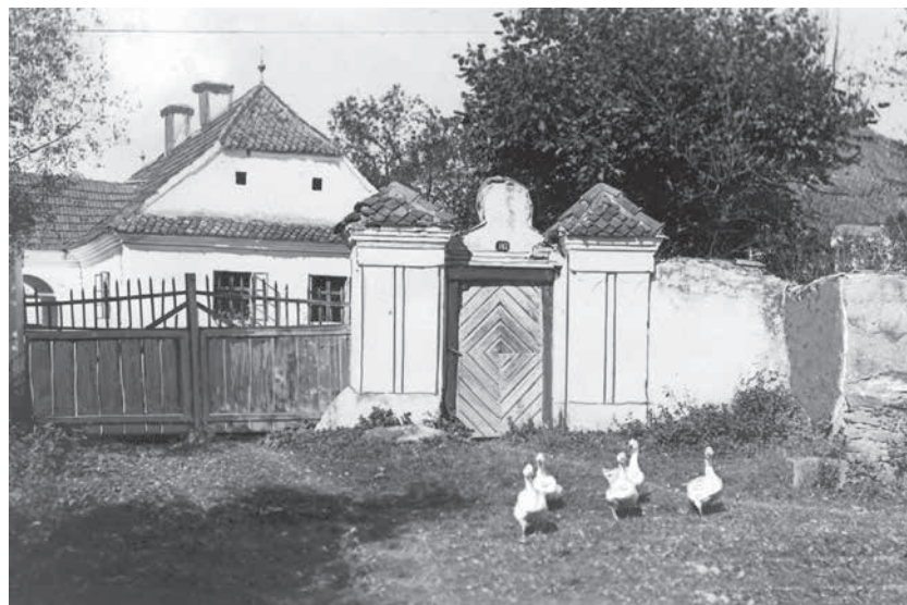
Koréh–Dénes-kúria 1930-as évek

vészet kutatója, akinek elméletei – az itáliai reneszánsz hatásáról és Mátyás király udvarának jelentős szerepéről – hosszú évtizedeken át meghatározták a magyar reneszánsz művészetről alkotott képet. 1934-ben a Magyar Művészet című folyóiratban megjelent, A reneszánsz építészet és szobrászat Erdélyben című tanulmányában a háromszéki kúriákról mint új épülettípusról a XVII. és a XVIII. századi késő reneszánsz és kora barokk művészet tárgyalásakor is ír. 11 A jellegzetes székelyföldi XVII. századi reneszánsz művészet központjának Háromszéket tartotta nemcsak az építészet, hanem a kőfaragás terén is.