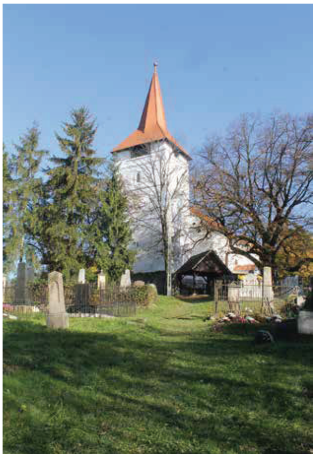
A bikfalvi református templom középkori tornya az egykori lőrészekkel 2020

Az erdélyi udvarházak kutatói között feltétlenül ki kell emelnünk B. Nagy Margit munkásságát, akinek tanulmányai és forráskiadásai ma is alapnak számítanak a témában. 1970-ben jelentette meg Reneszánsz és barokk Erdélyben című kötetét, amelyben az Udvarházak és stílusok című tanulmánya több érdekes adattal szolgál a háromszéki udvarházakkal kapcsolatosan is. 13 Véleménye szerint a jellegzetesen háromszéki típusnak tartott, oszlopokon vagy pillérekén nyugvó, kiugró tornác az inventáriumok tanúsága alapján Erdély-szerte a XVII. századi kúriák és kastélyok sajátossága volt, és összefüggött a homlokzat elé épített lépcsős feljáróval vagy sokszögű filagóriával. Háromszéken ez a forma általánosan elterjedt a kúriaépítészetben és a XIX. század első feléig is tovább élt. Mivel gyakran helyi mesterek építették, keveredett a népi építészet jellegzetességeivel, sajátos jellegzetes kölcsönözve az épületeknek. Ezt a jelenséget, a reneszánsz művészet és a népművészet szoros kapcsolatát Balogh Jolán és B. Nagy Margit is kiemelte, Kónya Ádám pedig egyenesen „népi udvarházaknak” nevezte a bikfalvi kúriákat. 14