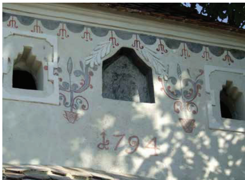
A sepsiszentgyörgyi Serestej-ház díszesen kifestett homlokzata 2014

Ennek a felfedezésnek köszönheti egy hasonló korú, 1794-ben készült kis kúria, a sepsiszentgyörgyi Serestej-ház is azt, hogy díszes homlokzatfestése előkerült. Felhívtuk a tervező építész figyelmét a bikfalvi esetekre, így megvizsgálták a ház homlokzatát, amin pompás motívumok kerültek elő. (Közvetítésünkkel sikerült feltárni és restaurálni a kúria homlokzatát, ugyanis 2011-ben