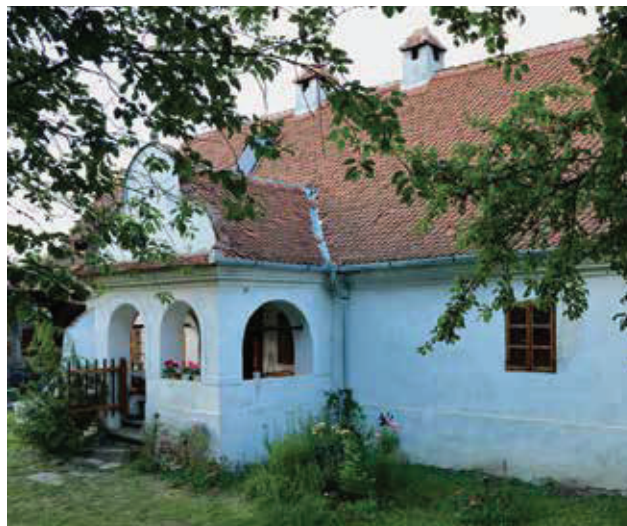
A Koréh–Dénes-kúria felújítás után 2020