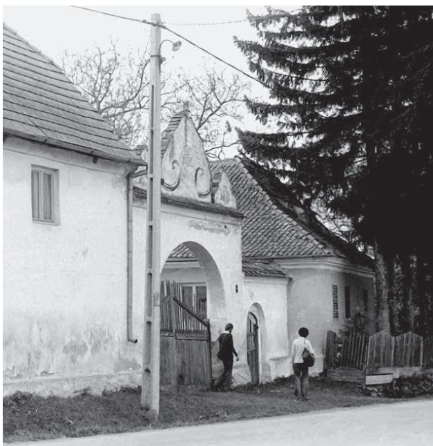
A Simon-kúria oromzatos kapuja 1982

Bár egyetlen román család sem lakott Bikfalván, a trianoni döntést követően, még a 20-as években „székely közmunkából” ortodox templom épült a főutca mentén, amelyhez a Jancsó-kúria telkéből szakítottak le egy darabot. (Ezt a templomot azóta is csinosítják, az elmúlt években apostolokat ábrázoló mozaikdíszek kerültek kerítésére.)