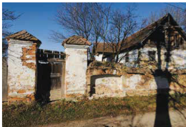
A Komán-kúria romos állapotban

A Megyei Tanács anyagi támogatásával és saját forrásból 2009–2010-ben azokat az emblematikus kapuzatokat is helyreállítottuk, amelyek meghatározták Bikfalva arculatát. Így a főút menti Simon-kúria 1797-ben készült fedeles kapujának két méter magas, barokk oromzatát, amely az 1990-es földrengés következtében dőlt le, és a már említett Zsigmond-kúria nagykapuját, amely statikai megerősítést is kapott a díszítőfestések restaurálása előtt. A Koréh–Dénes-kúria kapulábjainak 1830-ban készült stukkódíszzeit Kónya Ádám felvételei alapján sikerült rekonstruálni, és visszakerült az a kis oromzat is a „gyalogkapu” fölé, amit csak a Kós–Gödri-fotókról ismerünk.