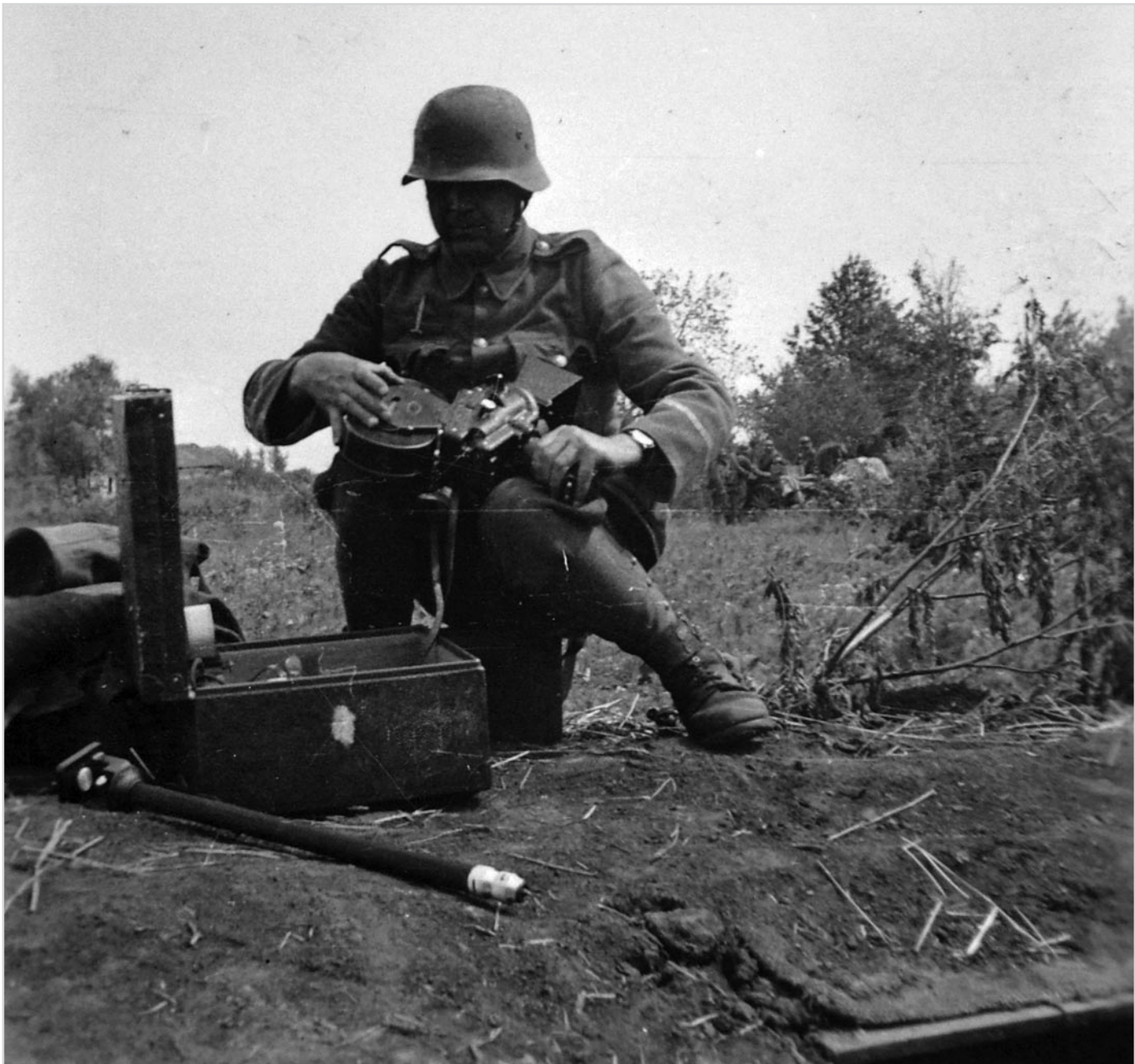
A Magyar Királyi Haditudósító század filmoperatőre, 1942

kocsi oldalának dőlve vagy gyertyalángnál. Forró földön íródtak ezek a riportok, mindig az események sodrában.” 11 Egyetérthetünk azzal is, hogy a haditudósító „a harc krónikása”, 12 és valójában „munkatöbbletet kapott. A harcok után a katona pihen, ő dolgozik.” 13 AKNAY Ernő szerint: „A régi haditudósító kényelmes élete és az eseményeken