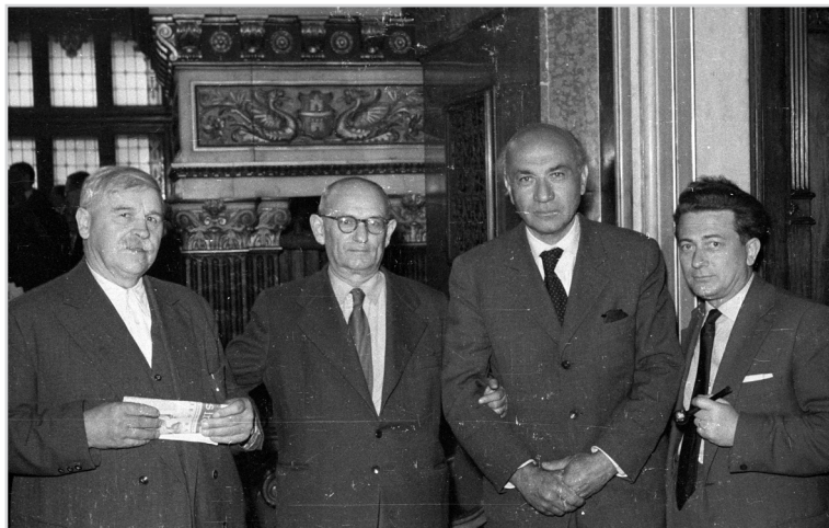
Balról jobbra: Veres Péter író, Bárdosi Németh János költő, Illyés Gyula író, Pákolitz István költő az Írószövetség közgyűlésén, a pesti Új Városháza üléstermében, 1962

gyárság épp most veszítette el a nemzeti egészségének egyik fontos zálogát: identitását, függetlenségét, a nemzeti létének megfelelő társadalmi forma megválasztásának lehetőségét.