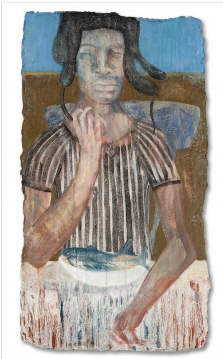
Király Gábor: Makrelák reggelire, 2021