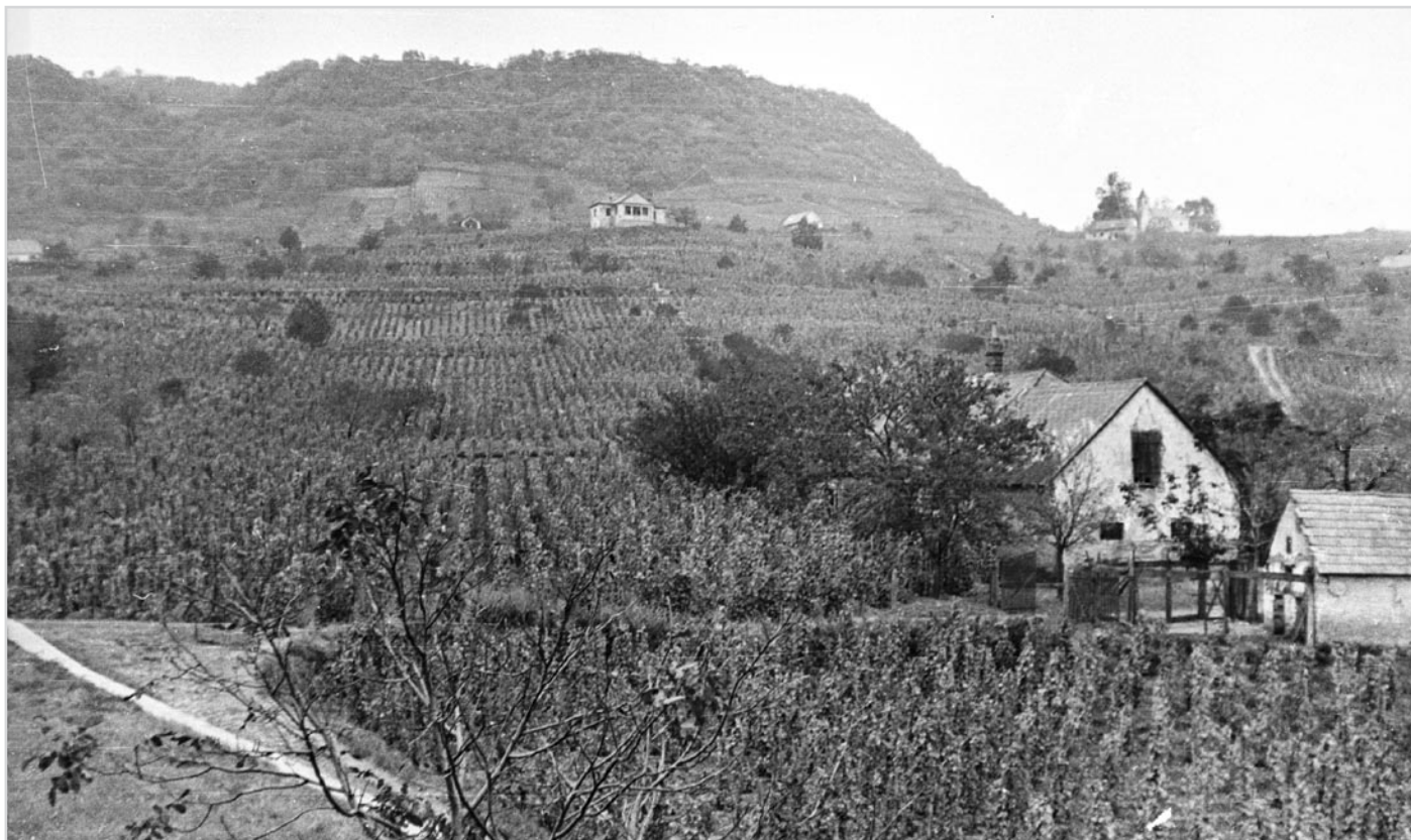
Szőlőültetvények és borászatok a Somló oldalában, 1959

lan tartalmi gazdagodással művelt műemléki topográfia a mai napig központi szerepet játszik. Az elért eredmények ugyanakkor a műemlékvédelem társadalmi beágyazottsága alakulásának függvényében államonként és régióként is szignifikánsan eltérő sajátosságokat mutatnak.