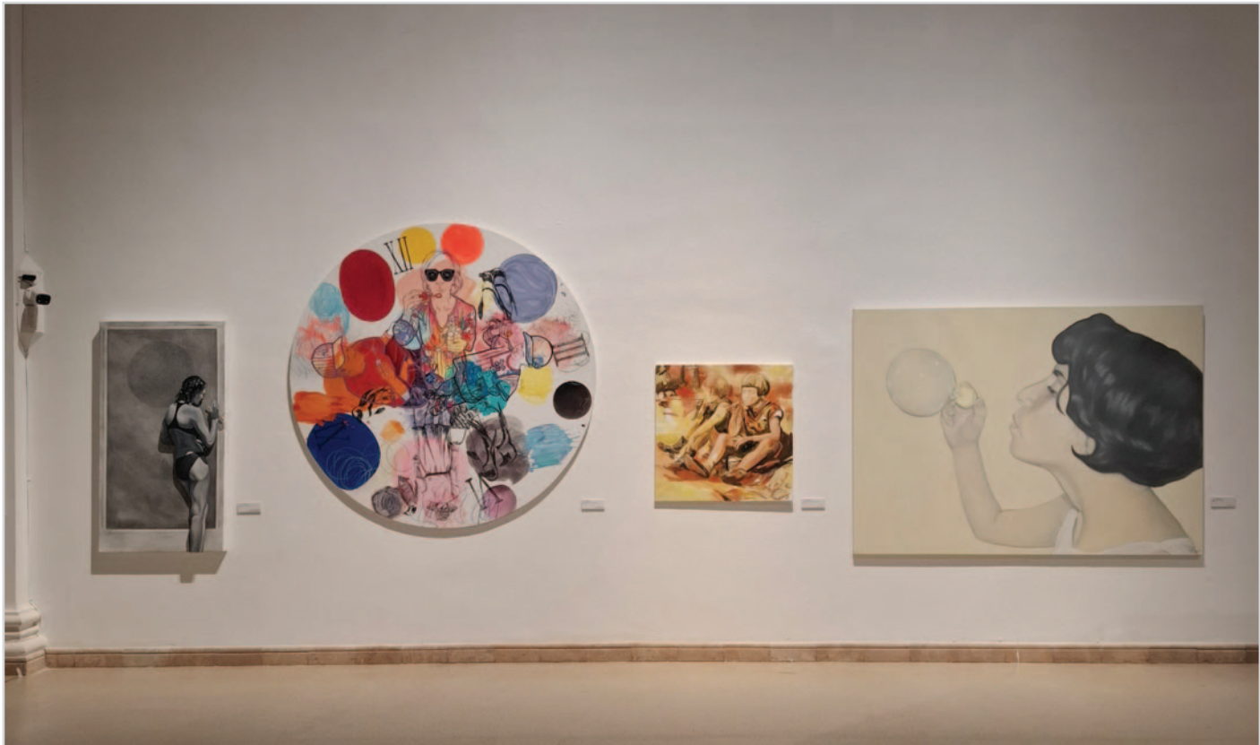
A Vanitas-olvasatok című kiállítás enteriőr képei, Múcsarnok, 2025

A koponya és a csontvázak ábrázolásai egyértelmű utalások az emberi élet mulandóságára, de a művészek számára fontos jelentéssel bír a körülöttünk lévő világ mulandóságának megmutatása is – az elpusztult állatok, növények a tönkrement, eltörött tárgyak megjelenítésén keresztül. Ezen munkák esetében a művész megengedhet magának némi kívülállást, és megfigyelőként szemlélheti a halált, ez a hozzáállás nem jelent érzéketlenséget a mulandóság viszonylatában, csak a közvetlen emberi vég felidézéséről átlép egy távolságtartóbb attitűdbe. A legegyszerűbb megnyilvánulása a testi halálnak, amikor a test felnyitva, már csak húsként van jelen. A XVII. századi festészetnek kedvelt tematikája volt a mészárszékek és húsboltok ábrázolása, akár a csendéleteken belül is. A megnyúzott, felbontott és kiterített állati test bemutatása még éppen azt a pillanatot rögzíti, amikor még emlékeztet valami a korábbi létformájára, de a feldolgozás vagy a bomlás már elkezdődött. Ebben az egységben számos munka illusztrálta a művész érdeklődését a körülöttünk lévő világ