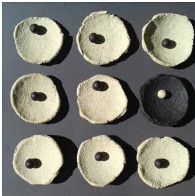
F. Orosz Sára: Hang-szín-balansz samott, 2017