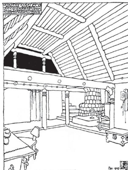
< Kós Károly: Vistai templom 1922