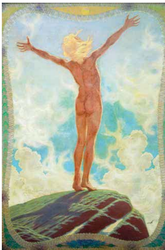
Fidus: Fényfohász 1922

lélek tökéletesedését, az „egész emberiség” fejlesztését szolgáló szabad levegőn végzett gimnasztikát, a fényfürdőzést. Felfogásuk szerint a meztelenség nem erkölcstelen, éppen ellenkezőleg, természetes forma, amelynek segítségével elkerülhető a szexuális „túlfűtöttség”, továbbá hozzásegít a természet által szabályozott szexualitáshoz. Az általuk vallott új szexuális morált az előítéletektől mentes nevelési reform fontos eszközeként tekintették.